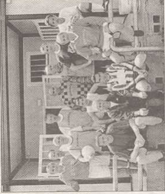
■ La funzione religiosa e la squadra dei papà all'oratorio San Carlo di Bariana in occasione della Festa del Grazie